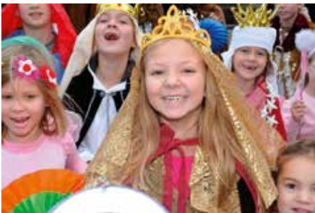
Enthousiaste kinderen tijdens het Driekoningenzingen

De traditie Driekoningenzingen is een van de oorspronkelijke autochtone tradities en is in 2012 op de Nationale Inventaris Immaterieel Erfgoed geplaatst. Een plaats op die lijst is niet vrijblijvend. Niet voor de aanvragers en ook niet voor de betrokken gemeenten. Dit betekent dan ook dat de Werkgroep 3KZ Midden Brabant hard aan de weg timmert.