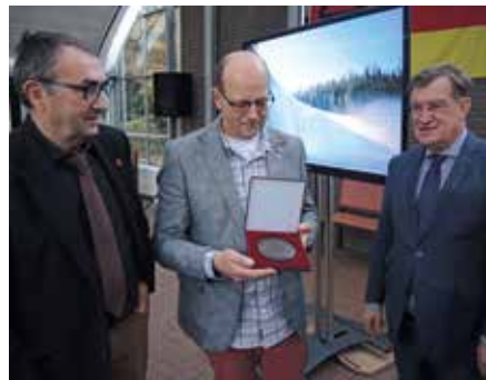
De Knippenbergpenning wordt bewonderd

De inzending van de kring uit Baarle-Nassau en Baarle-Hertog vond de jury bijzonder. „Inhoudelijk is de zaak gedetailleerd uitgewerkt in een boek en cursussen. Daarnaast is het grote publiek geïnformeerd door fiets- en wandeltochten, waarbij door reconstructies van de dodendraad een haast directe ontmoeting met het verleden mogelijk wordt gemaakt. Ook op het educatieve vlak raakt deze Baarlese onderneming een snaar, niet alleen in het onder-