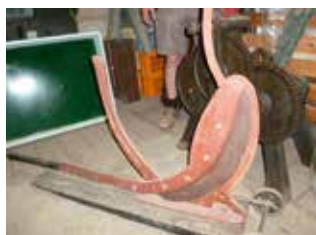
Een riet- of maïssnijder