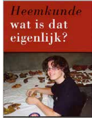
Het papieren exemplaar moet een DVD worden

Behalve het algemene gedeelte zouden heemkundekringen aan de presentatie een eigen stukje toe kunnen voegen over hun plaatselijke activiteiten. Brabants Heem zal hierover contact zoeken met Erfgoed Brabant. Daar werkt ook onze consultant Jurgen Pigmans die onlangs veel ervaring opdeed met het fenomeen film en dvd tijdens de opnames van 'De Canon van Lammers'. Mogelijk dat hij suggesties heeft om dit idee te verwezenlijken. In de komende regiovergaderingen zal geïnventariseerd worden of dit plan ook aanslaat bij de vele niet aanwezige kringen tijdens de Raad van Aangeslotenen.