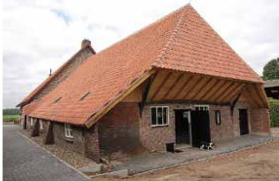
De gerestaureerde kap van de Aarlese Hoeve

samen met de gemeente de lokale en regionale bevolking te betrekken bij de restauratie en bij de informatie-uitwisseling met betrekking tot deze boerderij. De bevolking van Best en de inwoners van Het Groene Woud worden via dit educatieve project geïnformeerd en betrokken zodat er draagvlak voor het behoud van de boerderij in de toekomst zal blijven bestaan.