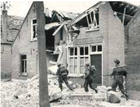
Schotse soldaten trekken in oktober 1944 via de Gasthuisstraat Kaatsheuvel binnen

Op verschillende plaatsen kwamen nog bevrijders een kijkje nemen of ze werden in het zonnetje gezet. Heemkundekringen hielden exposities of wijdden artikelen in hun tijdschriften aan de bevrijding. Vaak werd de aandacht verdeeld tussen de beide wereldoorlogen.