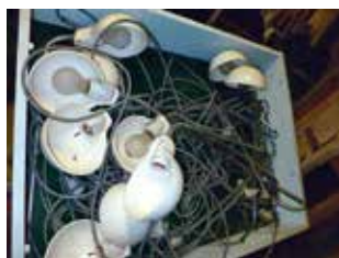
Een bak met lampjes