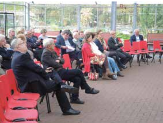
Het publiek bij de uitreiking van de Knippenbergprijs in het Klok & Peelmuseum in Asten

BAARLE-NASSAU – Grote vreugde enkele weken geleden bij heemkundekring Amalia van Solms in Baarle-Nassau-Hertog. Met het project 'WO1 in onze grensregio. Vergeten? Opgehelderd!', sleepte de vereniging de Knippenbergprijs 2014 in de wacht.