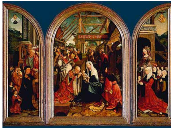
In de kunst komen de drie koningen regelmatig terug, zoals op dit drieluk van Jan Cornelisz van Oostsanen uit 1517

Ook zijn er activiteiten waar men op eigen initiatief aan kan deelnemen waaronder het ophangen van een kleurplaat voor het raam. Ook kan men informatiemateriaal opvragen