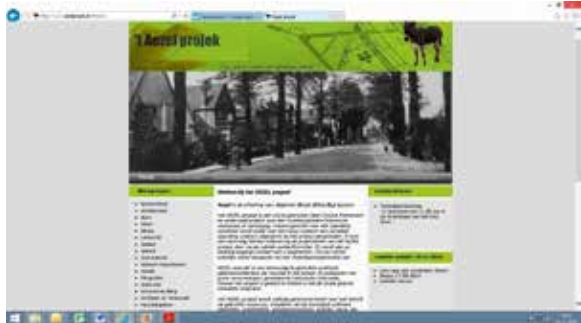
Het beeldscherm van het Aezel-project

Vandaar de vraag naar een cursus om duidelijkheid te scheppen in de soms wat schimmige wereld van gemeentelijke bestemmingsplannen. Brabants Heem gaat met