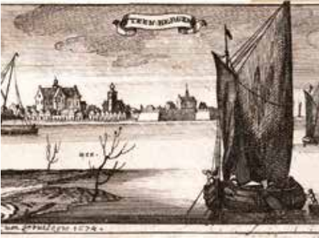
Een prent uit 1674 met de haven van Steenberg aan de open zee

In het verleden was dat niet anders. Vaak werd er gesteggeld over de aanleg en het open houden van de Steenbergse haven. In 1331 lag Steenberg nog 'aen den zeeboezem'. Het was een welvarend stadje, met name door de winning van zout uit turf. In dat jaar kreeg Steenberg het recht om een haven aan te leggen 'daer die coepmanne met haren scepen in moghen liggen ende scuilen jeghen den storm ende tquaet weder'. De stad mocht tol heffen om zich schadeloos te stellen voor de kosten.