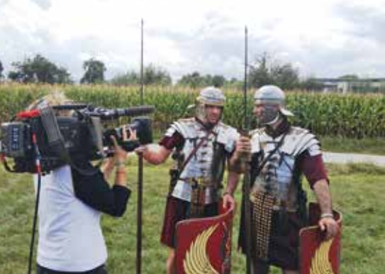
Frank Lammers als Romein in de serie 'De Canon van Lammers'

mers' speurtocht door de Brabantse geschiedenis. Frank bezoekt hierin alle windstreken, in het Nederlandse en in het Belgische deel van het oude hertogdom en ontmoet ter plekke bijzondere personen die hem meer vertellen over de unieke historie van Brabant. De Canon van Lammers is een coproductie van Erfgoed Brabant en Omroep Brabant en is op dit moment op tv te zien.