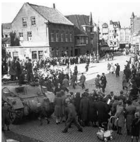
Colonne RAM-tanks van het Canadian Armoured Tank Corps The Kangaroos op 28 oktober op de Markt. (Collectie RA Tilburg)

• Bron: Diverse kranten in de periode september-oktober 2014.