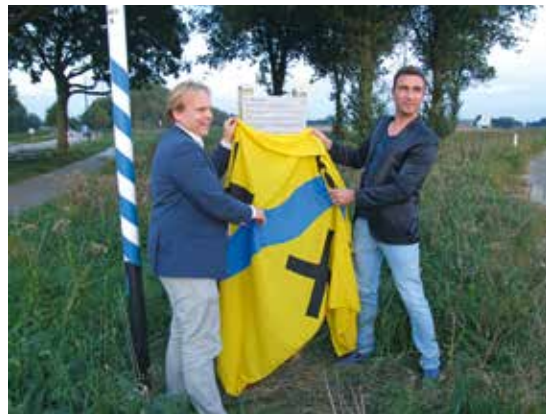
Het nieuwe bord, op de plaats waar Niervaart vroeger mogelijk lag, wordt onthuld

Bij de Sint Elisabethsvloed in 1421 werd de stad bijna geheel wegge-