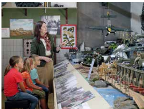
Kinderen krijgen uitleg over de expositie in het erfgoeddepot in Riel