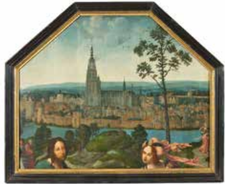
Christus en de Samaritaanse Vrouw bij de Stad Breda, anoniem (1518-1520), olieverf op paneel met het oudste stadsgezicht van Nederland