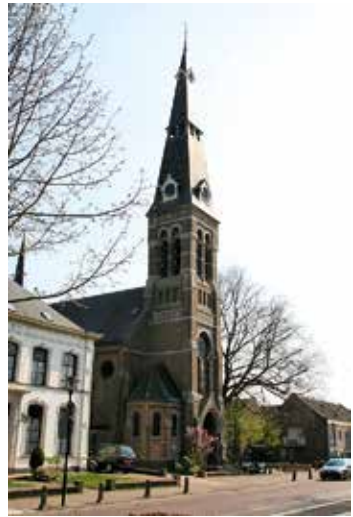
De Kerkstraat in Riel