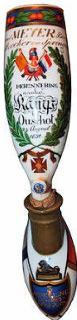
Een pijp van een militair ter herinnering aan het kamp bij Oirschot

• Bron: Brabants Dagblad , 9 september 2014 (Jan Keunen)