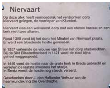
De tekst op het bord over het verdronken dorp Niervaart

Brand en Guus Borger. Zij onderzochten vier verdronken dorpen waaronder Niervaart. In de Ketel werd een tiental boringen gedaan. Hierbij werden geen resten van Niervaart gevonden maar wel zag men dat de ondergrond ernstig verstoord was. Er zat geen veen maar wel zanderige klei.