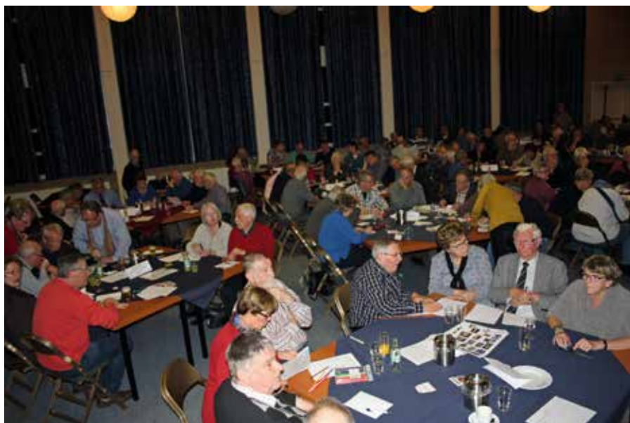
Een zaal vol quizteams, met op de voorgrond de ploeg uit Roosendaal