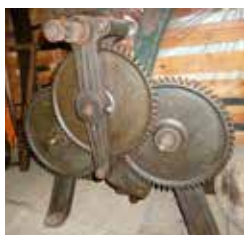
De machine om ijzeren banden te maken