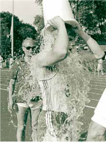
Een emmer water ter verkoeling

over plaatselijke geschiedenis. Het BHIC timmert de laatste jaren flink aan de weg als historische centrum en heeft een uitgebreid archief met foto's. En wij hebben weer een podium dat veel mensen bereikt. Zo zijn de eerste ideeën ontstaan voor deze nieuwe website."