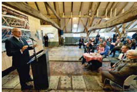
Prof. Mr. Pieter van Vollenhoven tijdens zijn woordje bij de heropening van de Aarlese hoeve