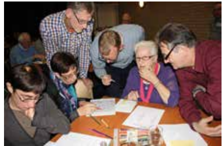
Het team uit Nispen aan de slag met een doe-vraag

4. Paulus van Daesdonck (Ulvenhout) 83 punten. 5. Engelbert van Nassau (Breda) 83 pnt. 6. De Honderd Hoeven (Hoeven) 82 pnt. 7. Jan uten Houte (Etten-Leur) 78 pnt. 8. De Vrijheijt van Rosendale (Roosendaal) 76 pnt. 9. Die Overdraghe (Klundert) 73 pnt. 10. Stichting Hooghe Heerlickheyt (Wernhout), 72 pnt. 11. De Steenen Kamer (Steenbergen) 71 pnt. 12. Nyen Aen-