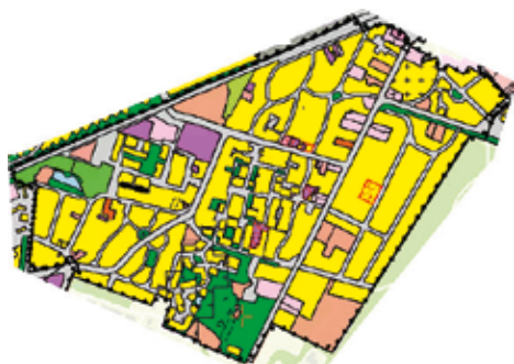
Een willekeurig bestemmingsplan als voorbeeld

Erfgoed Brabant overleggen of daar iets aan gedaan kan worden. Mogelijk dat dit resulteert in een cursus op niet al te lange termijn of twee cursussen in zowel Oost- als West-Brabant.