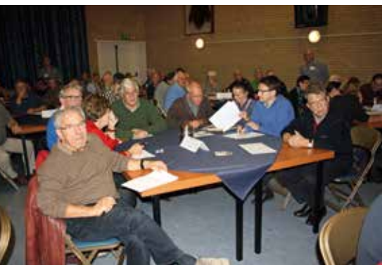
Eén van de teams luistert naar de volgende vraag