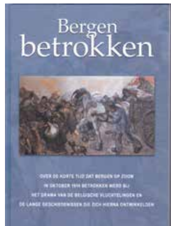
De band van het nieuwe Bergse boek

„Niet omdat wij de pretentie zouden hebben om grote verhalen toe te kunnen voegen